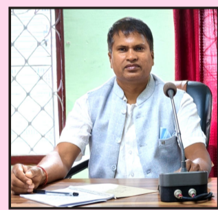
लेखक: पन्नालाल दास

जुत्ता सिउने, कृषि उत्पादन गर्ने, पशुपालन गर्ने तथा औजार निर्माण गर्ने कार्य सबै समुदायका लागि आवश्यक भए पनि उत्पादन गर्ने