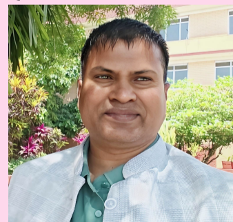
लेखक: पन्नालाल दास

विवादको जड तयार पारेका छन्। नेपालले लिम्पियाधराबाट काली नदी सुरु हुने ऐतिहासिक नक्सा, अभिलेख र प्रमाण प्रस्तुत गर्दै सो क्षेत्र आफ्नो सार्वभौम भूभाग भएको दाबी गर्दै आएको छ। तर भारतले नदीको उद्गम फरक स्थानबाट देखाउँदै कालापानी क्षेत्रमा आफ्नो प्रशासनिक नियन्त्रण र सुरक्षा उपस्थितिलाई आधार बनाएको छ। ब्रिटिसकालीन सन्धि र त्यसपछिका नक्साहरूको तुलना गर्दा सीमा निर्धारणमा एकरूपता नदेखिनु मुख्य समस्या बनेको छ। प्रारम्भिक नक्साहरूले नेपाल पक्षको दाबीलाई समर्थन गर्ने संकेत गरे पनि पछि विभिन्न समयमा तयार पारिएका नक्साहरूमा परिवर्तन देखिन्छ।