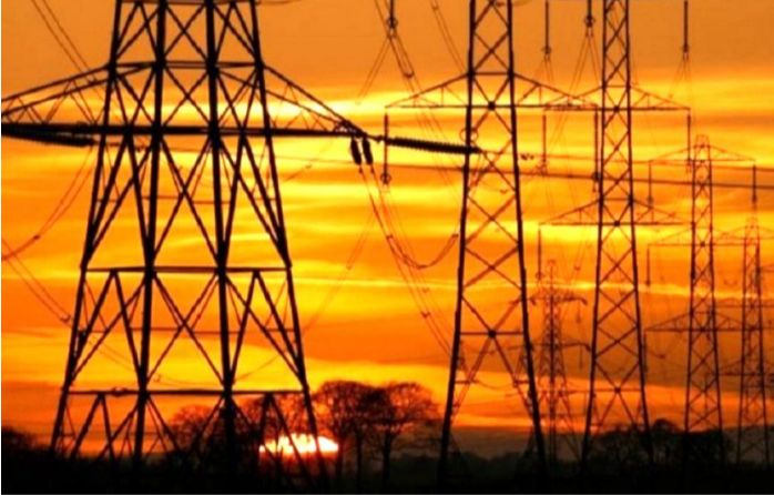
हाल देशमा करिब ३ हजार

२६ बैशाख, काठमाडौं। नेपालमा कुल विद्युत् जडित क्षमता ४ हजार २५६ मेगावाट पुगेको छ। ऊर्जा, जलस्रोत तथा सिँचाई मन्त्रालयका अनुसार यो तथ्यांक नेपाल विद्युत् प्राधिकरण र निजी क्षेत्रबाट उत्पादन भएको विद्युत् आधारमा निर्धारण गरिएको हो। मन्त्रालयले परीक्षण चरणका आयोजनाहरू तथा वैकल्पिक ऊर्जा स्रोतबाट उत्पादित विद्युत् भने यस तथ्यांकमा समावेश नगरिएको स्पष्ट पारेको छ।