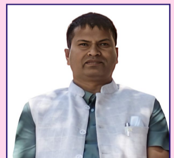
लेखक: पन्नालाल दास

बनिरहेका छन् भन्ने स्पष्ट देखाउँछ। नेपालको कानूनले बोक्सीको आरोप लगाएर गरिने हिंसालाई गम्भीर अपराध मानेको छ। मुलुकी अपराध संहिता, २०७४ अनुसार यस्तो आरोपमा कुटपिट, अपमान वा अमानवीय व्यवहार गर्ने व्यक्तिलाई पाँच वर्षसम्म कैद र जरिवानाको व्यवस्था छ। तर कानून कागजमै सीमित हुँदा अपराधीहरू निडर भन्दै गएका छन्। त्यसैले अब राज्य केवल दर्शक बनेर बस्ने होइन, कठोर र निर्मम रूपमा कानून कार्यान्वयन गर्नुपर्ने बेला आएको छ। खासगरी मधेश प्रदेशमा यस्ता अन्धविश्वासजन्य घटनाहरू अझ