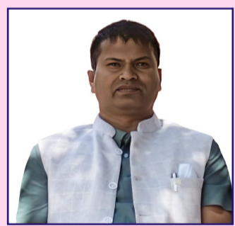
लेखक: पन्नालाल दास

नेपाल लामो समयदेखि पेट्रोलियम पदार्थमा भारत निर्भर रहँदै आएको छ। यसले ऊर्जा क्षेत्रमा संरचनागत परनिर्भरता बनाएको छ, जसले स्वदेशी स्रोत विकासतर्फको पहललाई कमजोर बनाएको देखिन्छ। स्वदेशमै ग्यास उत्पादन सुरु भए ऊर्जा आयातको स्वरूप बदलिने सक्ने भए पनि त्यसका लागि आवश्यक राजनीतिक दृढता र स्पष्ट कार्ययोजना अझै देखिएको छैन। अर्कोतर्फ, ग्यास उत्खनन जस्तो जटिल प्रक्रियाका लागि उच्च लगानी, उन्नत प्रविधि र दक्ष जनशक्ति आवश्यक पर्छ। विदेशी लगानी र प्राविधिक सहकार्य अपरिहार्य भए पनि स्पष्ट नीति,