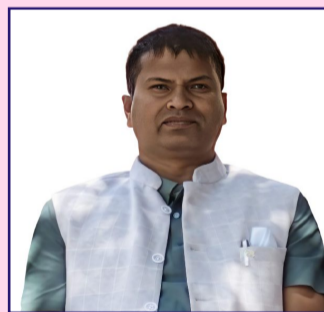
लेखक: पन्नालाल दास

बजारमा फैलिएको चर्चा अझ गम्भीर छ। केहीको आरोप छ-कुहिने प्रकृतिका तरकारी र फलफूलजन्य सामग्री नगरपालिकाभित्रैका कर्मचारी वा जनप्रतिनिधिहरूले उपभोग गर्ने गरेका छन्। यद्यपि, यसको आधिकारिक पुष्टि हुन सकेको छैन। तर यस्ता प्रश्न उठ्नु नै पारदर्शिताको अभावको संकेत हो। अर्को यथार्थ पनि उचितकै कटु छ-दिनभर लखेटिएका व्यापारीहरू साँभ्रपख फेरि त्यहीँ आएर पसल थान बाध्य छन्। यसले देखाउँछ कि समस्या समाधानभन्दा पनि 'लखेट्ने र फर्किने' चक्र चलिरहेको छ। बजार व्यवस्थापनको दीर्घकालीन समाधानतर्फ नगरपालिका गम्भीर देखिँदैन भन्ने आरोप बलियो बन्दै गएको छ। बजार अनुगमन पनि नियमित