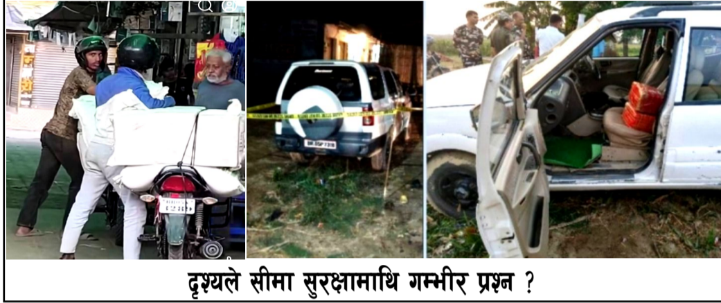
दृश्यले सीमा सुरक्षामाथि गम्भीर प्रश्न ?