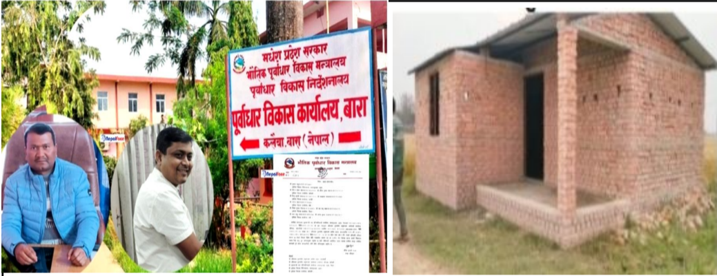
बारा पूर्वाधार प्रमुख साहमाथि कडाइ

तेलकुवामा क्रसर उद्योगको मनपरी : अनुगमन समितिमाथि प्रश्न, राजस्व छली र वातावरणीय संकट गहिरिँदै