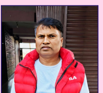
लेखक: पन्नालाल दास

बारा जिल्लामा असिनापानी र हावाहुरीले किसानको बालीमा ठूलो क्षति पुऱ्याएको छ। गर्मी र वर्षायाममा आगलागी, बाढी र खानेपानी संकट हुने जोखिम बढ्दै गएकोले जिल्ला विपद् व्यवस्थापन समितिसहित सम्बन्धित निकायले पूर्वतयारीमा सक्रिय हुन आवश्यक छ।