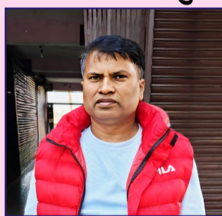
लेखक: पन्नालाल दास

“नयाँ राजनीतिक म्यानडेटले आशा जगाएको छ, तर पुरानै प्रशासनिक ढाँचा, बिचौलिया प्रभुत्व र ढिलासुस्तीले जनतालाई अझै पिरोलिरहेको छ। अब चुनौती केवल सरकार गठन होइन, व्यवहारमा पारदर्शिता र सुशासन देखाउनु हो, नभए आशामा तुसारापात हुने निश्चित छ।”