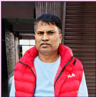
लेखक: पन्नालाल दास

“नेपालमा ग्यास अभाव बारम्बार दोहोरिँदै आएको छ। दीर्घकालीन समाधानका लागि आयातित ग्यासमा निर्भरता घटाएर विद्युत प्रयोग बढाउनु, स्वदेशी स्रोतको उपयोग अघि बढाउनु र सस्तो, सुलभ ऊर्जा उपलब्ध गराउनु अब अपरिहार्य छ।”